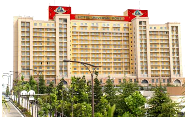
外観ラッピングイメージ