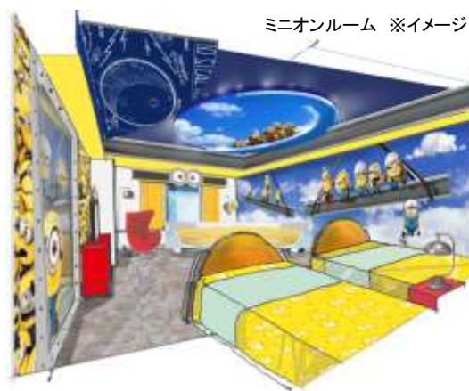
ミニオンルーム ※イメージ

ベクターのソファやミサイル型のベッド、お部屋を覗いている「ミニオン」からは、おしゃべりが聞こえてきそう！ 「ミニオン」の世界観を存分に楽しめるミニオンルームで大人も子供も笑顔いっぱいでお過ごしいただけます。