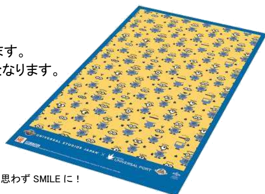
「ミニオン」のオリジナルレジャーシート ※イメージ

2015年11月1日(日)以降にご宿泊いただく際にも「ミニオン」のアイテムを限定特典として予定しております。 お楽しみにお待ちください。