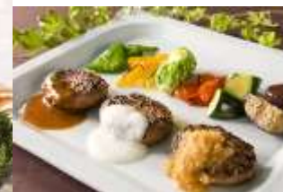
国産和牛ハンバーグ

8月以降は ビッグマウンテンケーキに替わる “びっくり驚き”な エンターテインメントメニュー が登場します。 ご期待ください！