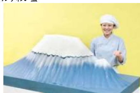
ビッグマウンテンケーキ