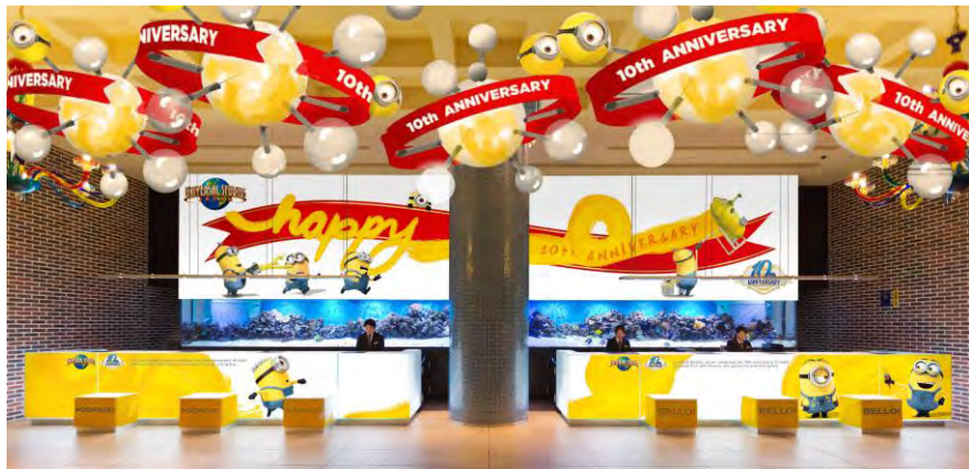
『ミニオン』のスペシャル・デコレーション (イメージ)

【期間】2015年7月15日(水)～2016年7月14日(木)※予定 ロビーは『ミニオン』が開業10周年を祝うバースデーデコレーション をお手伝いしている姿をイメージした装飾を施し、ゲストの皆さまを 賑やかにお待ちしております。