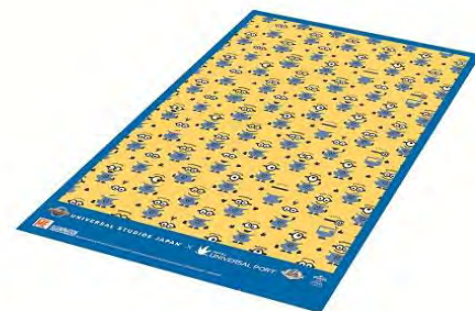
『ミニオン』のオリジナルレジャーシート (イメージ)

2015年11月1日(日)以降にご宿泊の際にも『ミニオン』のアイテムを 限定特典として予定しています。