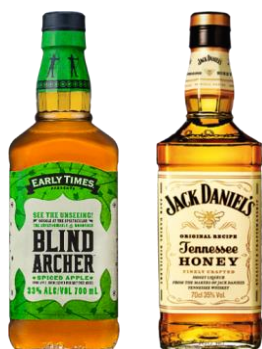
左「アーリータイムズ ブラインドアーチャー (青りんごフレーバー)」 右「ジャックダニエル テネシーハニー (はち みつ味)」

スパイスメニューでビールがすすむ！ 「トムヤムつけ麺」(左)と「ヤムニョムチキン」(右)は シェフのいちおし！