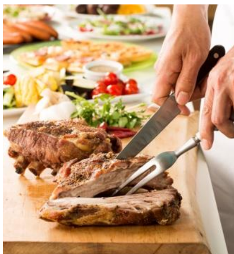
シェフが目の前で切り分ける「国産骨付き豚バラ肉のロースト」 豪快にカブリ！で一層「うまい！！」

飲 物 / アサヒスーパードライ、アサヒ黒生、スパークリングワイン(4種)、赤ワイン(4種)、白ワイン(4種)、 サングリア(赤・白)、フレーバードウイスキー(2種)、ウイスキー、ハイボール、カクテル、ビアカク テル、酎ハイ、焼酎、梅酒、ソフトドリンクなど40種類以上