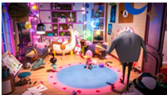
映画「怪盗グルーのミニオン危機一発」より

室内は、作中でアグネスが座っていた巨大“クマのチェア”や子どもたちのお部屋にある