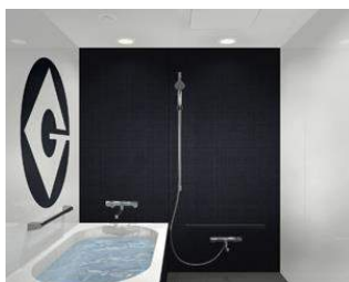
「世界一の悪党」を目指すグルーの趣味趣向満載のバスルーム