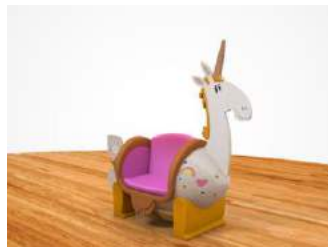
アグネスの大好きなユニコーンがソファになった！