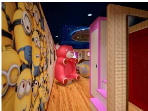
お部屋に入ると、ミニオンたちが興味深々ゲストをお出迎え！