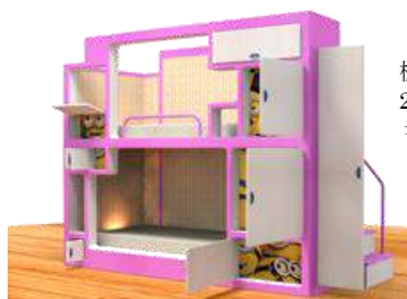
棚に見立てた2段ベッドにはミニオンがいっぱい