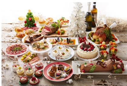
ディナーバイキング 「ローストビーフとクリスマスフェア」イメージ

宿泊プランは、毎年大人気の“サンタクロースがお部屋を訪問する”スペシャルプランをはじめ、パーティ料理やクリスマスケーキをセットにした企画をご用意しました。最上階 PORT DEEP OCEAN FLOOR の特別室「プレミアムパレス」には、フロアテーマ「深海」をイメージした高さ約2mのクリスマスツリーがきらめき、神秘的な海底のクリスマスを演出します。