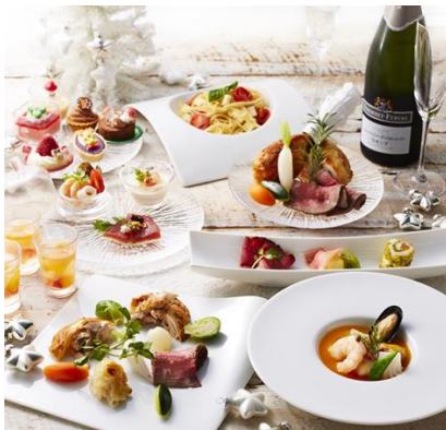
ローストビーフとクリスマスフェア (イメージ)

ローストビーフ、ローストチキン、国産骨付き豚バラ肉のロースト、ローストターキーのペペロンチーノ、サーモンとクリームチーズのパイ包み焼き、魚介類のナージュ仕立て、まぐろのカルパッチョ トリュフ風味、ずわい蟹とカリフラワーのムース、クリスマスケーキ、ブッシュドノエル など