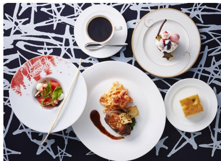
蟹ときのこのサラダ仕立て/フェットチーネ 海老のトマトクリームソース/牛フィレ肉とフォアグラのソテー トリュフソース/クリスマスケーキ ※フォカッチャ、コーヒー付