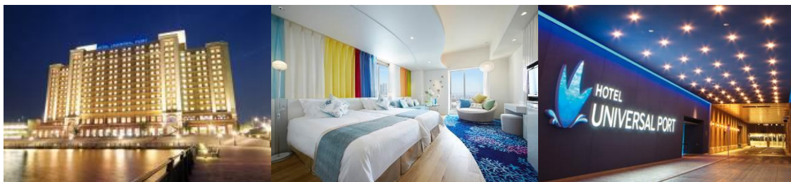
TM & © 2017 Universal Studios. CR17-3225