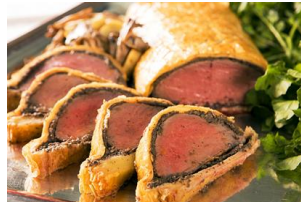
牛フィレ肉のパイ包み焼き