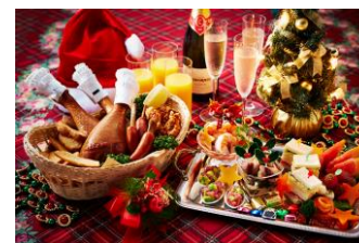
オードブル 8種/ビッグチキン/スモークターキーレッグ/骨付きフランク/フライドポテト

その他、クリスマスケーキ付プラン、シャンパン&オードブル付プランなど、多彩なクリスマス限定宿泊プランを販売します。