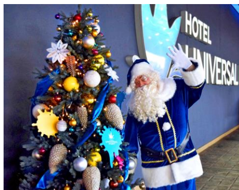
2016年「サンタグリーティング」より

11月10日（金）～12月25日（月）の期間、ロビーやエントランスにイエロー&ブルーのオーナメントがきらめくクリスマスツリーが並び、ロビー中央の高さ約3mの「ゴールドツリー」が華やかにクリスマスを彩ります。また、12月22日（金）からはポートのイメージカラーである“ブルー”の衣装をまとったサンタクロースが登場し、一緒に記念撮影できる「サンタグリーティング」を実施します。